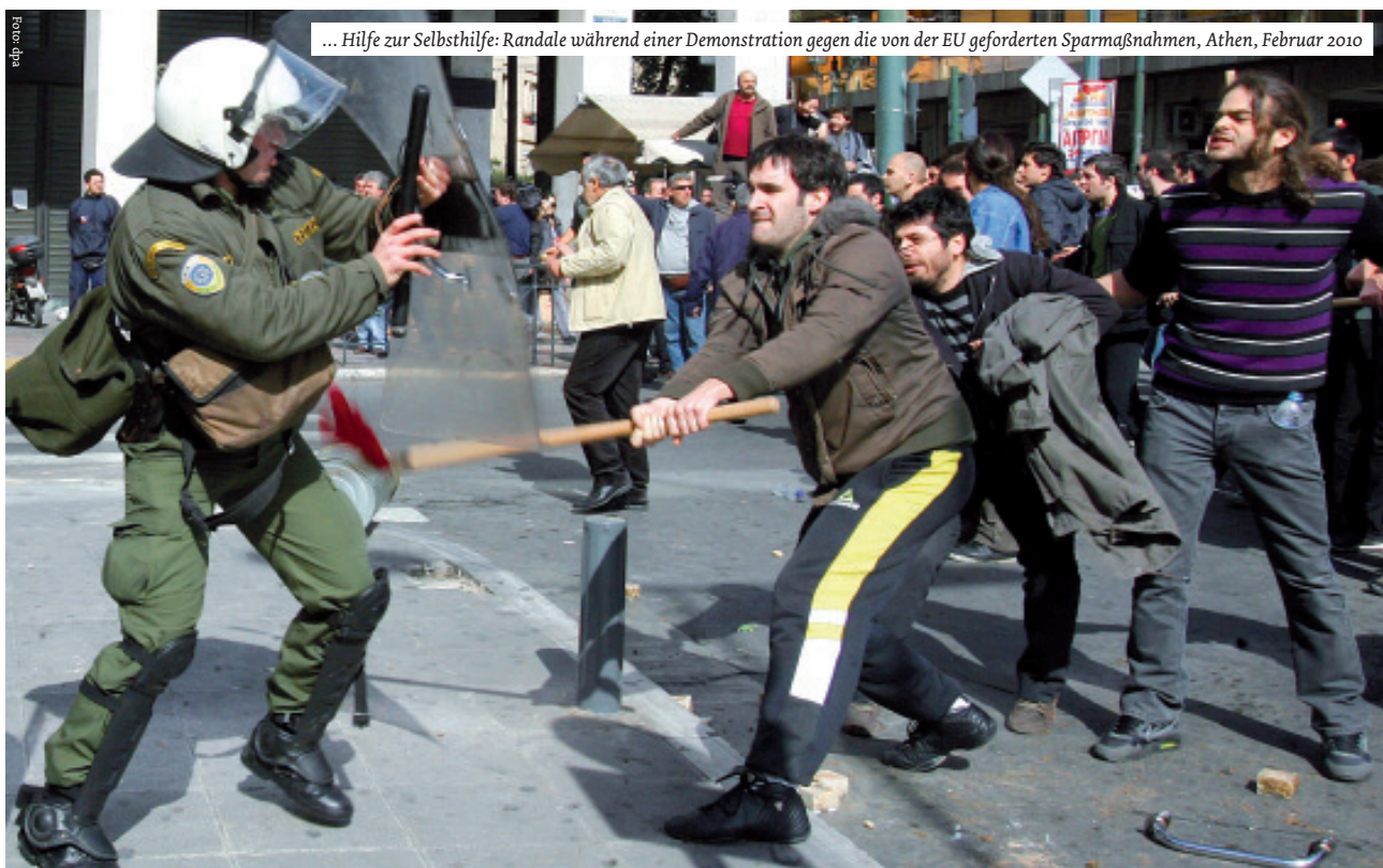
... Hilfe zur Selbsthilfe: Randalen während einer Demonstration gegen die von der EU geforderten Sparmaßnahmen, Athen, Februar 2010

All dies sei hier erwähnt, weil sich im Land der Täter fast niemand mehr daran erinnert, anders als im Land der Opfer. Daß man dort